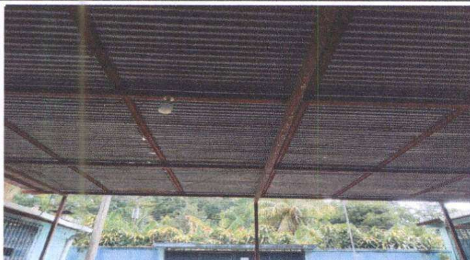
Foto1: Galera Principal