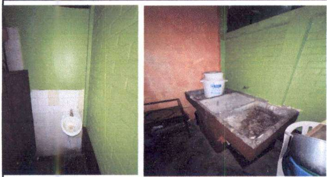
Foto1: Sustitución de lavamanos por batería de concreto