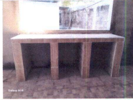
Foto 14: Sustrucción de mueble de cocina de madera por concreto y azulejo