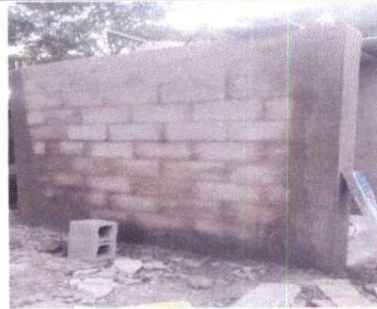
Foto 18: Sustrucción de estructura de madera por metal y lámina por lámina calibre 26

Observación: Si es necesario se pueden agregar hojas adicionales y actualizar el número de hojas.