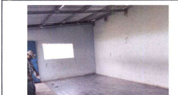
Foto 21: Sustitución de estructura de metal por metal y reparación de cableado eléctrico, lámparas, conectores y apagadores