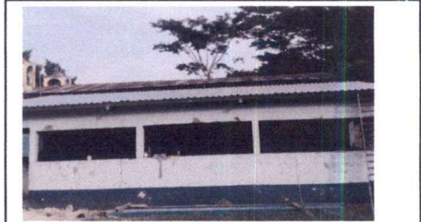
Foto 22: Sustitución de láminas troqueladas por láminas troqueladas calibre 26