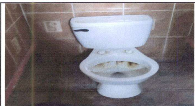
Cambio de accesorios en inodoros