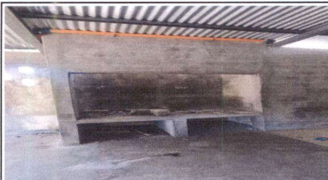
Reparación de polleton con cambio de lámina de chimenea, canal de agua pluvial