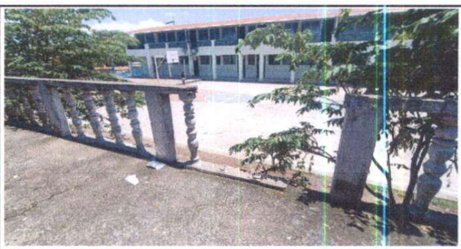
Reparación de pasamanos

Observación: Si es necesario se pueden agregar hojas adicionales y actualizar el número de hojas.