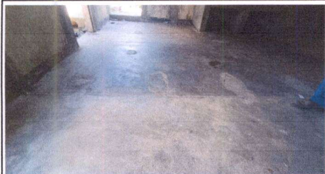
A nivelación de piso e instalación de piso cerámico