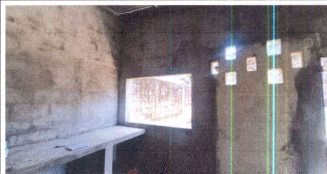
Instalación de azulejo en mesa de trabajo y instalación de balcones y ventanas PVC