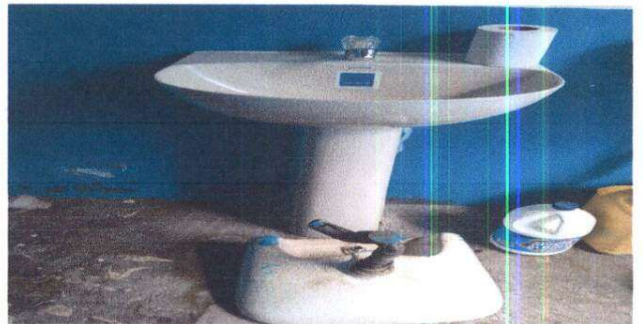
Foto 6. Sustitución de lavamano

Observación: Si es necesario se pueden agregar hojas adicionales y actualizar el número de hojas.