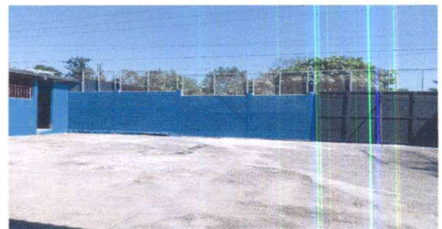
Foto 6. Sustitución de metal corredizo

Observación: Si es necesario se pueden agregar hojas adicionales y actualizar el número de hojas.