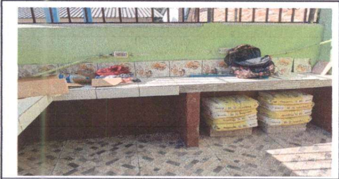
Foto 5. Suministro de azulejo y gabinetes en mesa de trabajo