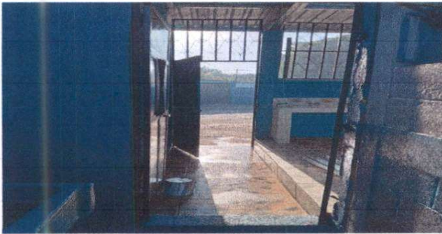
Foto 3. puerta para cocina