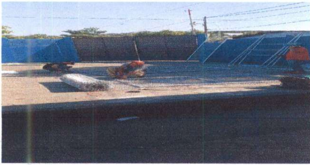
Foto 1. Sustitución de porton de metal corredizo