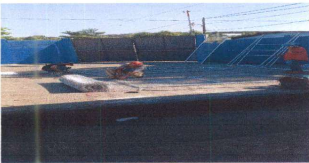
Foto 5. Reparación de muro perimetral