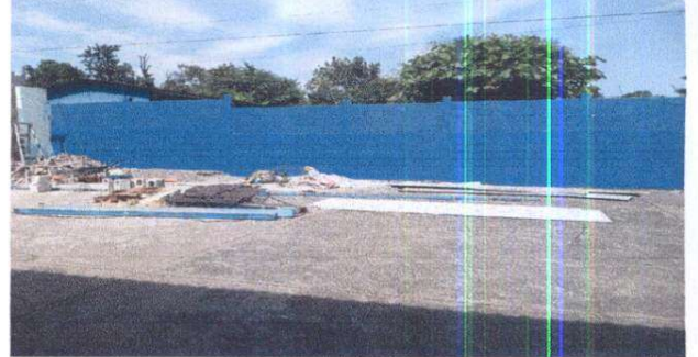
Foto 2. Pintura Interior