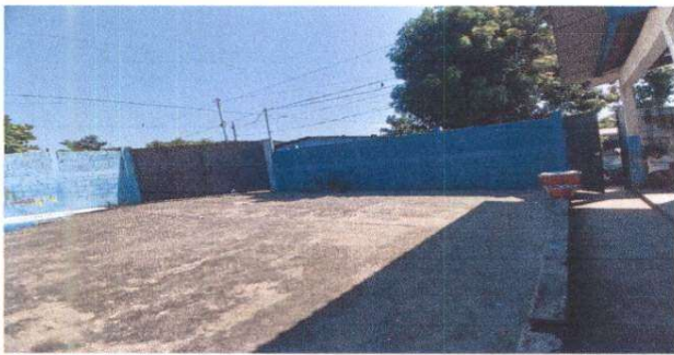
Foto 3. Pintura interior