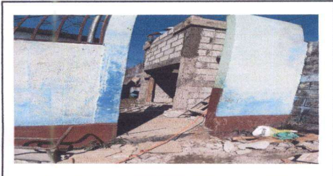
Foto 1. Suministro de puertas metálicas en cocina