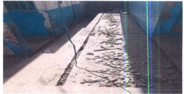
Foto 2. Reparación de red de drenaje y red de agua pluvial