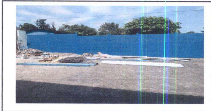
Foto 6. Reparación de tubo hg y malla galvanizada

Observación: Si es necesario se pueden agregar hojas adicionales y actualizar el número de hojas.