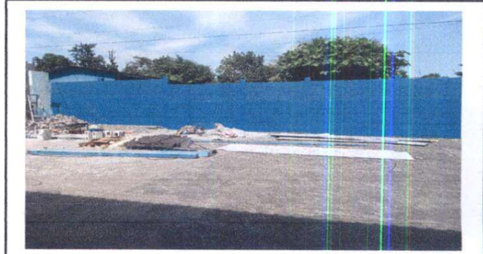
Foto 4. Pintura interior