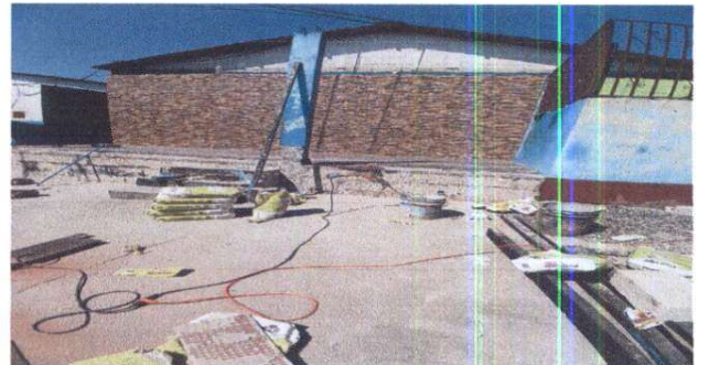
Foto. 4 Sustitución de Azulejo