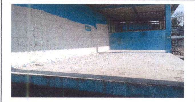
Foto 3. Suministro e instalación de azulejo