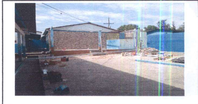
Foto 2. Sustitución de estructura y lamina