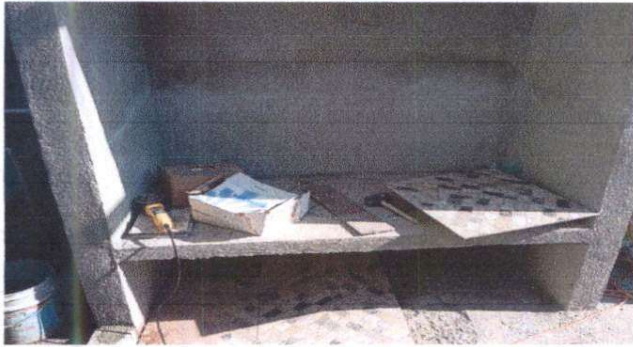
FOTO 1 Sustitución de estufa Rural (Completa) incluye chimenea y plancha de metal