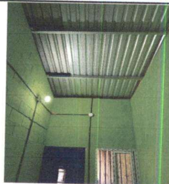
SUSTITUCION DE SISTEMA ELECTRICO Y DE FUERZA, FINALIZADO.