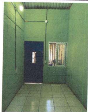
SUMINISTRO DE PARED PARA EVITAR FILTRACION DE AGUA , FINALIZADO