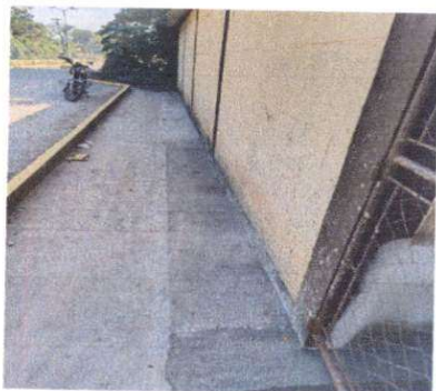
SUMINISTRO DE LOSA PARA EVITAR FILTRACION DE AGUA EN AULAS, FINALIZADO