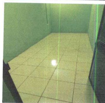
NIVELACION DE TORTA DE CONCRETO E INSTALACION DE PISO CERAMICO

Observación: Si es necesario se pueden agregar hojas adicionales y actualizar el número de hojas.