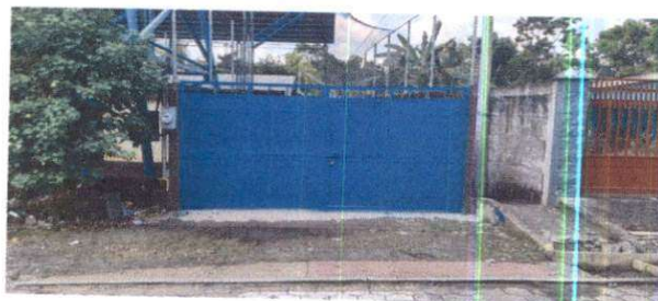
REPARACION DE PORTON, (SUSTITUCION DE VISAGRAS, LIJADO, CEPILLADO Y APLICACIÓN DE 2 CAPAS DE PINTURA ANTICORROSIVA)