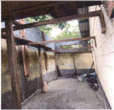
SUMINISTRO DE PARED PARA EVITAR FILTRACION DE AGUA