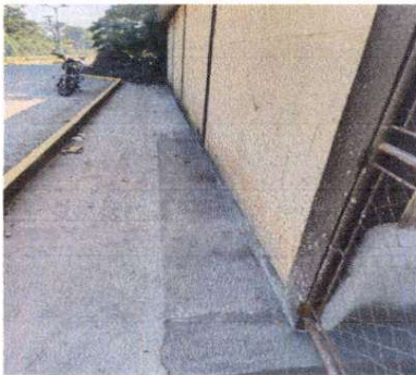
SUMINISTRO DE LOSA PARA EVITAR FILTRACION DE AGUA EN AULAS