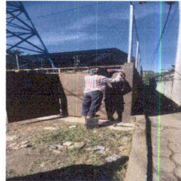
REPARACION DE PORTON, (SUSTITUCION DE VISAGRAS, LIJADO, CEPILLADO Y APLICACIÓN DE 2 CAPAS DE PINTURA ANTICORROSIVA)