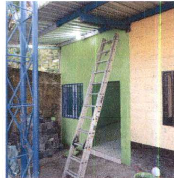
SUSTITUCION DE SISTEMA ELECTRICO Y DE FUERZA