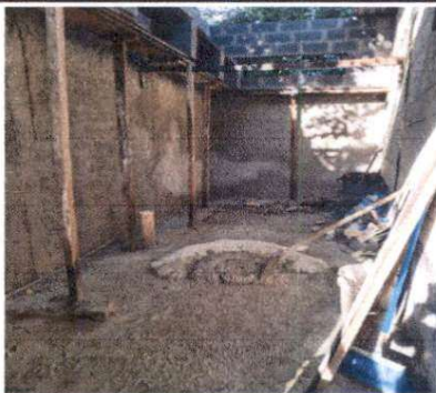
REPELLO EN MUROS E IMPERMEABILIZACIÓN DE PARED EN AULA PARA EVITAR FILTRACION DE AGUA