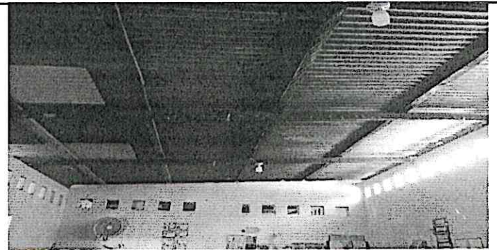
Foto 4: Sustitución de cubierta de lámina y estructura de madera por metal, reparación de sistema eléctrico y levantado de block para mejorar altura de techo