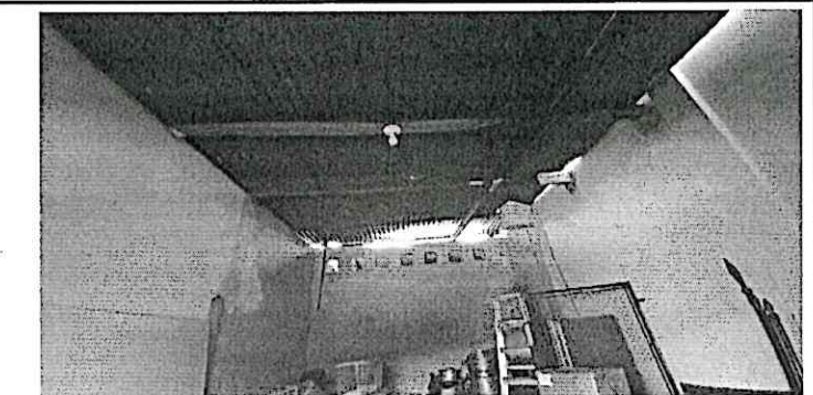
Foto 6: Sustitución de cubierta de lámina y estructura de madera por metal, reparación de sistema eléctrico y levantado de block para mejorar altura de techo

Observación: Si es necesario se pueden agregar hojas adicionales y actualizar el número de hojas.