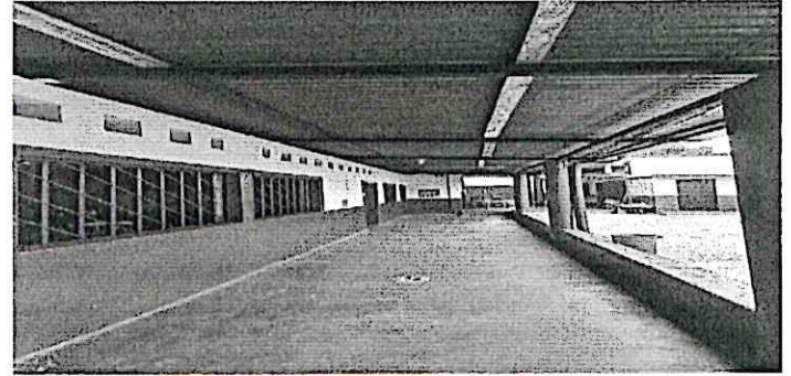
Foto 2: Sustitución de cubierta de lámina y estructura de madera por metal