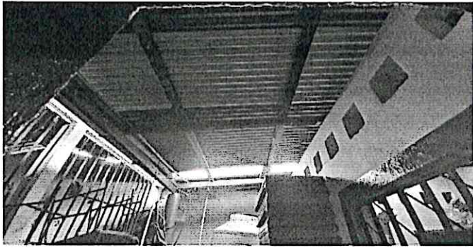
Foto1: Sustitución de cubierta de lámina y estructura de madera por metal, reparación de sistema eléctrico y levantado de block para mejorar altura de techo