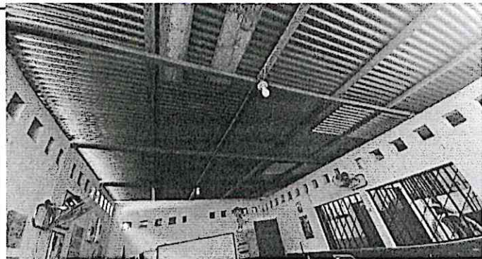
Foto 5: Sustitución de cubierta de lámina y estructura de madera por metal, reparación de sistema eléctrico y levantado de block para mejorar altura de techo