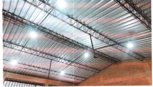
FOTO 4: Módulo de aulas 3 y 4 : Mantenimiento a estructura de soporte de metal