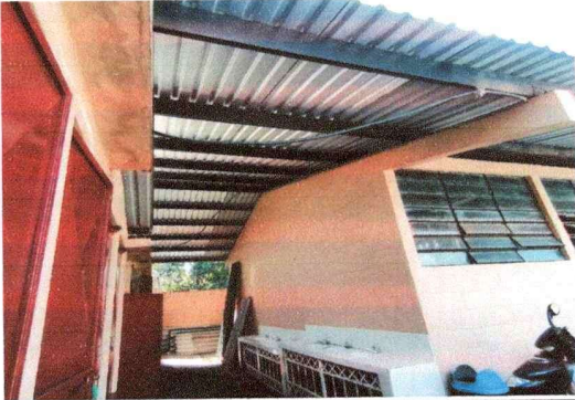
FOTO 3: Módulo de lavamanos: Sustitución de elementos de fijación