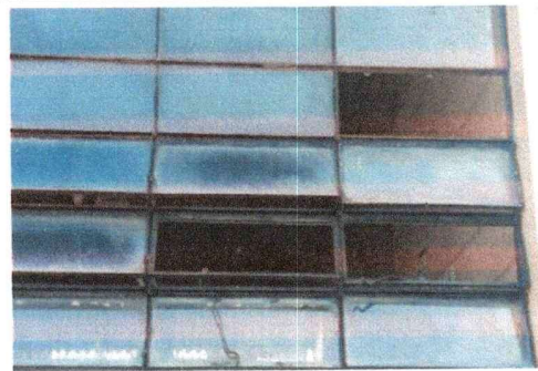
FOTO 6: Módulos de aulas 3 y 4: Sustitución de estructura de metal a ventana

Observación: Si es necesario se pueden agregar hojas adicionales y actualizar el número de hojas.