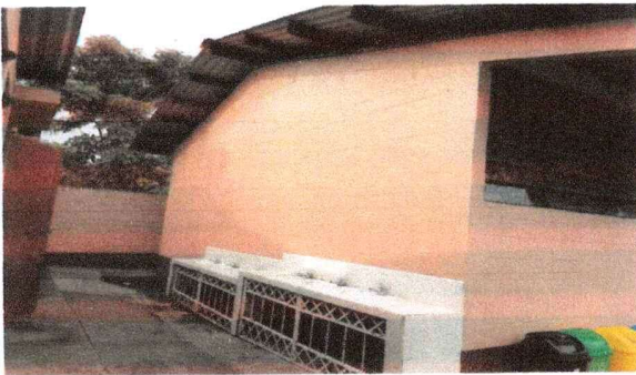
FOTO 3: Módulo de lavamanos: Sustitución de elementos de fijación