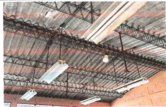
FOTO 4: Módulo de aulas 3 y 4 : Mantenimiento a estructura de soporte de metal