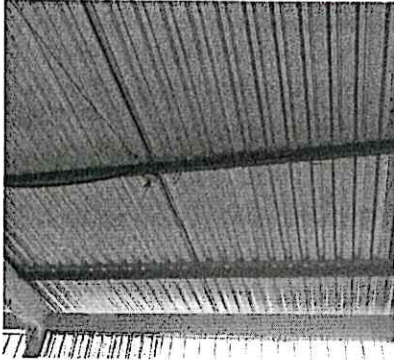
Foto1: Sustitución de lamina