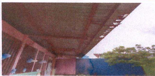
Foto 5 sustitución de Canales de metal