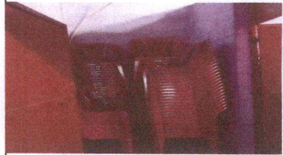
Foto 1 instalacion de gabinetes co divisiones