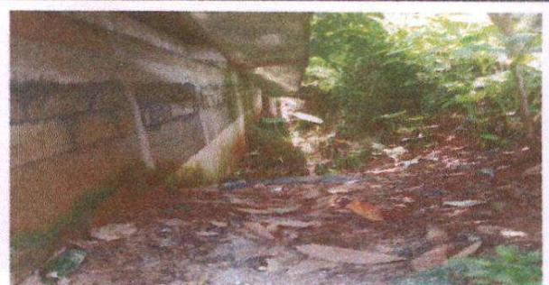
foto 6 Repello y cernido de pared

Observación: Si es necesario se pueden agregar hojas adicionales y especificar el número de hojas.