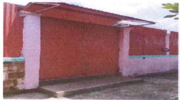
foto 4 instalacion y ampliación de portón