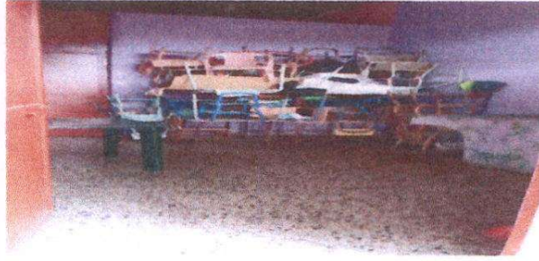
Foto 1 Instalacion de polleton con chimenea y placha