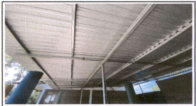
Estructura de techo de area de cocina