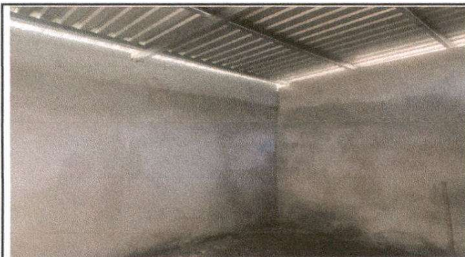
Suministro de muro perimetral de block