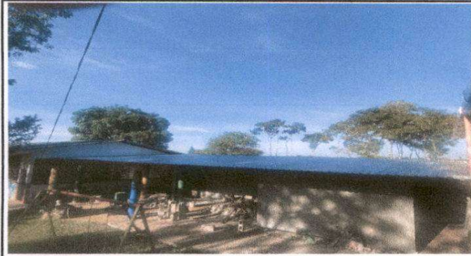
Estructura y techo de area de cocina