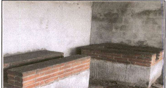
Elaboracion de Estufas rurales