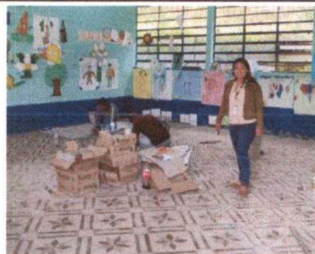
Sustitución de piso de torta de concreto por cerámico. (CUBIC BEIGE 008755)