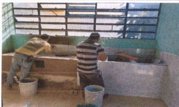
Instalación de pila 1.60 mts de largo por 0.80 cms de ancho por 0.80 cms de alto