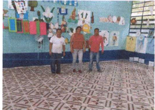
PISO MÓDULO 1 AULAS 1, 2 Y 3.