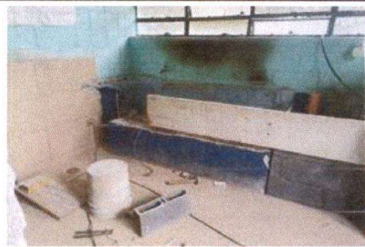
Sustitución de Estufa Rural (completa incluye chimenea y plancha de metal).

Observación: Si es necesario se pueden agregar hojas adicionales y actualizar el número de hojas.