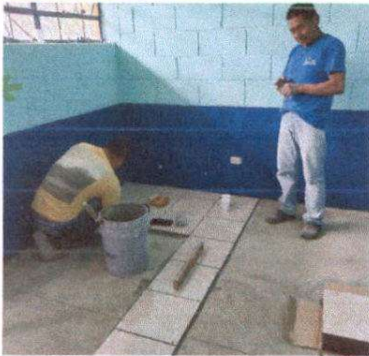
Sustitución de piso de torta de concreto por cerámico. (CODIGO (ANORA MARBLE 2006333)