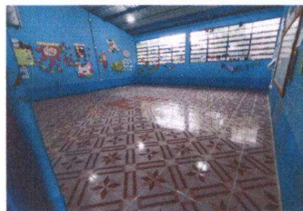
Foto 6: Mano de obra de sustitucion de piso de torta por ceramico en 2 aulas

Observación: Si es necesario se pueden agregar hojas adicionales y actualizar el número de hojas.