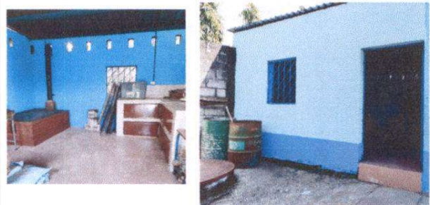
Foto 4: Suministro de puertas de metal de gabinete, Sustitución de estufa rural completa incluye chimenea y plancha de metal, Pintura