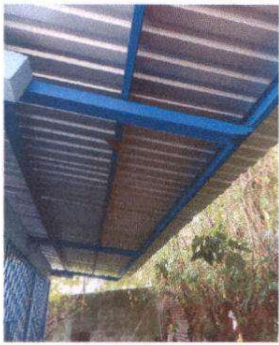
Foto 1: Suministro de lámina por lámina troquelada Aluzinc calibre 26