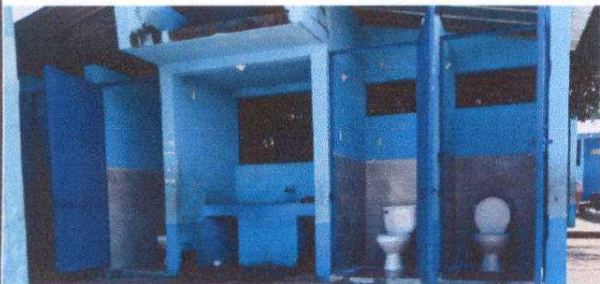
Foto 5: Sustitución de piso de torta de concreto por cerámico en 4 baños, Suministro de azulejo en 4 baños,