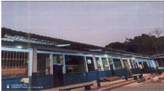
Foto1: Infraestructura del edificio de Telesecundaria con buena iluminación y su techado nuevo así como las costaneras.