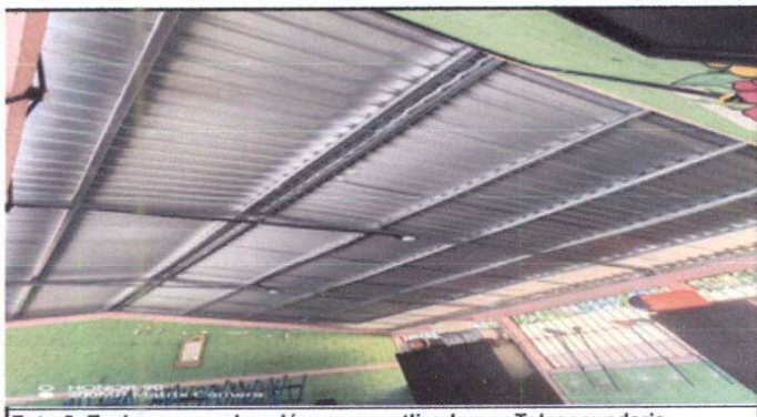
Foto 5: Techo nuevo de salón que es utilizado por Telesecundaria.