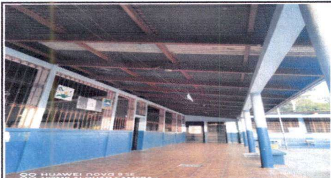
Foto 3: Infraestructura del techo a cambiar con remozamiento(corredor)