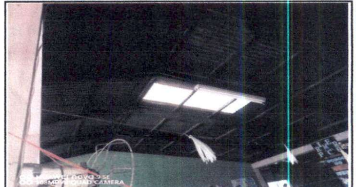
Foto 4: Infraestructura del techo del aula que es utilizada por la primaria.