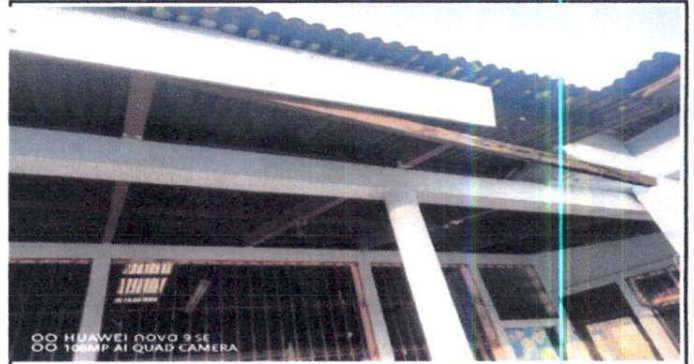
Foto 2: Infraestructura del techo donde se puede apreciar las tendales que no estan en buen estado, siendo este un peligro para la comunidad educativa.