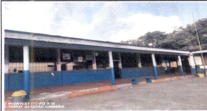
Foto1: Infraestructura real del techo del Instituto Nacional de Educación Básica de Teelesecundaria.