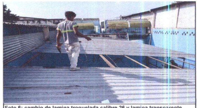
Foto 6: cambio de lamina troquelada calibre 26 y lamina transparente

Observación: Si es necesario se pueden agregar hojas adicionales y actualizar el número de hojas.