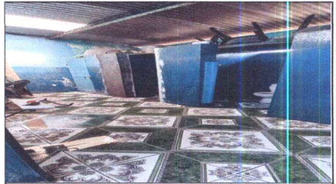
Foto 4: sustitución de puertas metálicas, elaboración de división metálica y baranda en la parte superior