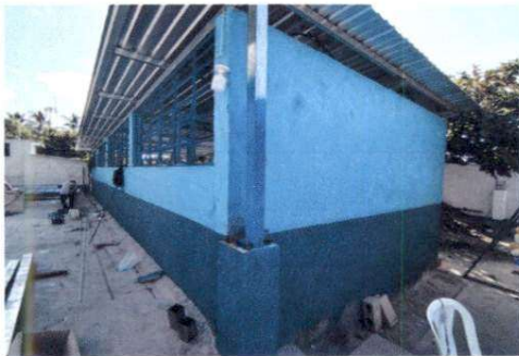
Foto 9: Se realizó la instalación de ventanas de vidrio y el levantamiento del muro de los salones de cuarto primaria.