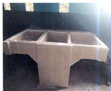
Foto 6: Se azulejó por completo la pila de la cocina. Mejorando así el área y la higiene para cuando se inicie a cocinar.

Observación: Si es necesario se pueden agregar hojas adicionales y actualizarlas en las hojas de hojas.