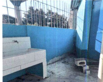
Foto 4: Se realizó la reparación completa de la pared que está cerca de los baños, evitando así riesgos con los niños y niñas, al mismo tiempo logrando una mejora en infraestructura.