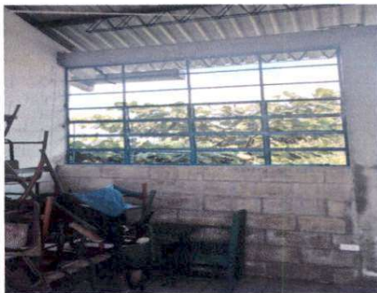
Foto 11: Suministro e instalación de ventanas de metal con vidrio en el salón de segundo primaria, en el segundo nivel de la escuela.