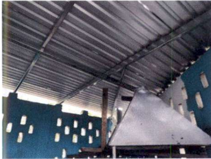
Foto 1: Se realizó el cambio de toda la lámina de la cocina de la escuela, logrando así mejorar el ambiente en dónde las madres cocinarán los alimentos para los niños y niñas.