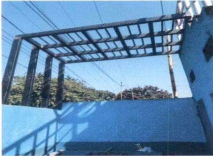
Foto 7: se realizó la instalación de la base metálica en el módulo de los baños para poder colocar el rotoplas. Ya que no contaba con la misma.