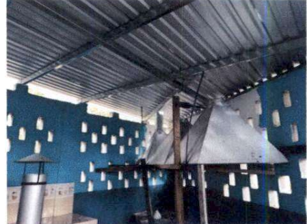
Foto 2: Se realizó el cambio de la estructura de madera por estructura metálica, para colocar las láminas nuevas, mejorando así aún más el ambiente en la cocina.