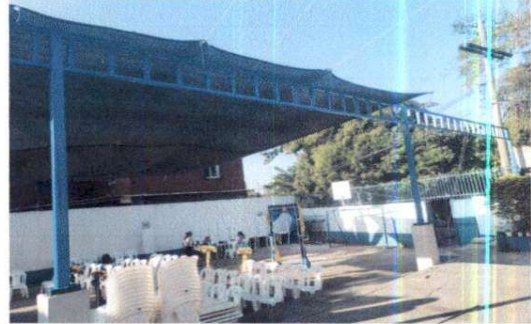
Foto 8: Se realizó la instalación de los tubos galvanizados en el área deportiva, generando así un ambiente adecuado y evitando que los rayos del sol peguen fuerte cuando los niños realicen sus actividades deportivas.