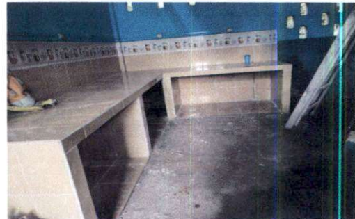
Foto 10: Se realizó la colocación de azulejo a todo el gabinete que se encuentra en la cocina. Mejorando así este ambiente.