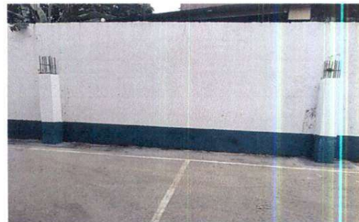
Foto 12: Se realizó el refuerzo en el muro perimetral de la escuela.

Observación: Si es necesario se pueden agregar hojas adicionales y actualizar el número de hojas.