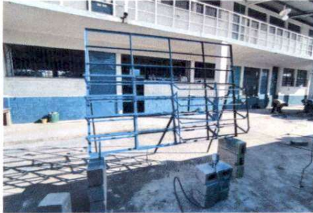
Foto 7: Elaboración de los ventanales para el aula de segundo grado sección "B"