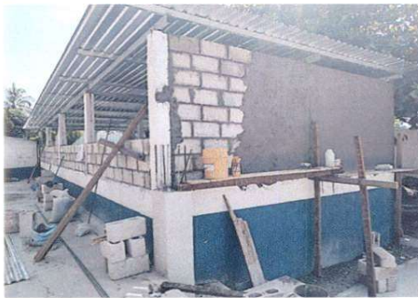
Foto 9: Instalación de ventanas de vidrio y colocación de block en la parte de enfrente y en los costados de los salones de cuarto.