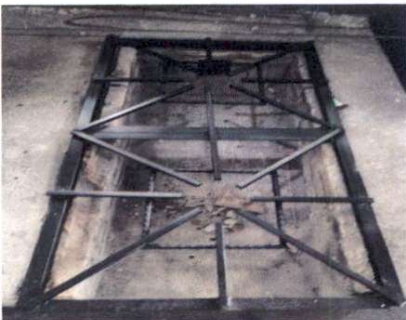
Foto 3: Instalación de parrillas en estufa rural, ya que no contaba con la misma.