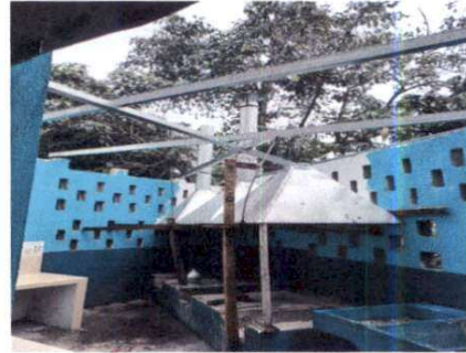
Foto 2: Cambio de estructura de madera por estructura metálica para colocación de lámina.