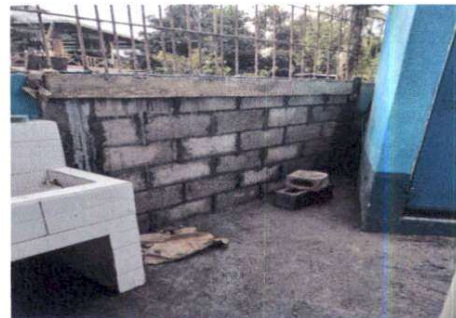
Foto 4: Reparación de la pared que se encuentra a la par de los baños.