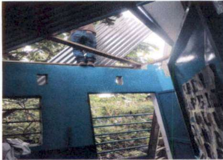
Foto1: Cambio de lámina de la cocina.