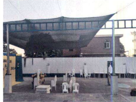
Foto 8: Instalación de tubos rellenos galvanizados y costaneras en muros para poder colocar la manta en la cancha, evitando así los rayos del sol.