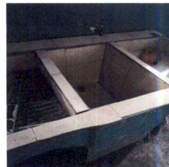
Foto 6: colocación de azulejo en la pila que se encuentra en la cocina.

Observación: Si es necesario se pueden agregar hojas adicionales y actualizar el número de fotografías.