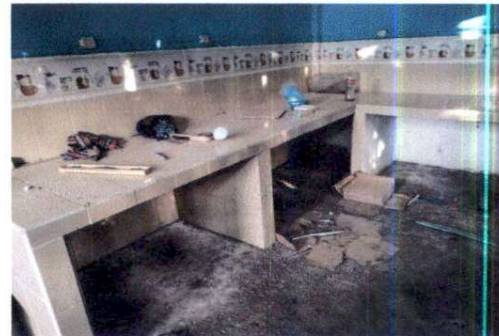
Foto 10: Colocación de azulejo en gabinete que se encuentra en la cocina.