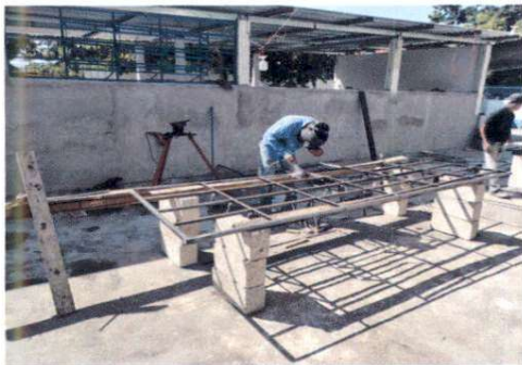
Foto 11: Instalación de ventanas de vidrio en los salones de cuarto primaria.