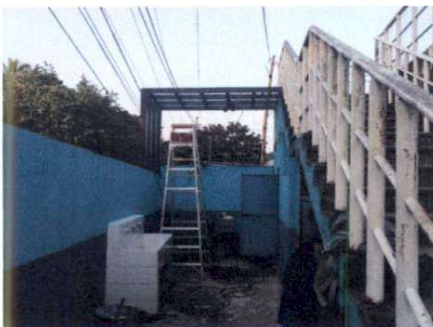
Foto 5: Instalación de la estructura metálica en el módulo de baños para colocación de rotoplas.