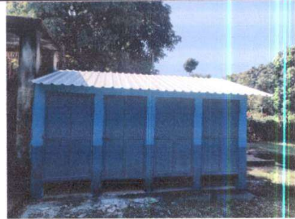
Foto 2: SUSTITUCIÓN DE SANITARIO, TORTA DE CONCRETO, INSTALACIÓN DE AZULEJO, SUSTITUCIÓN DE PILA