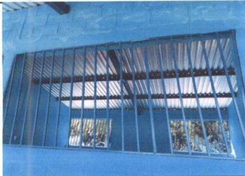
Foto1: MANTENIMIENTO DE BALCONE