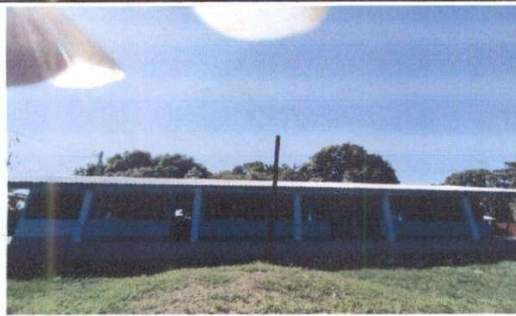
PINTURA DE INTERIOR Y EXTERIOR, REPARACIÓN DE PUERTAS