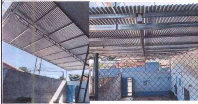
Sustitución de lámina por lámina acanalda zintro alum c26 legítima