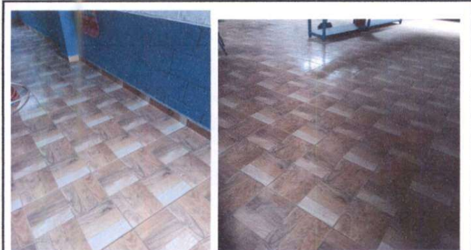
Instalación de piso cerámico, salon 1 y 2 primer nivel.