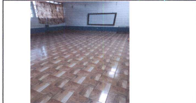
instalación de piso cerámico salón 3 segundo nivel