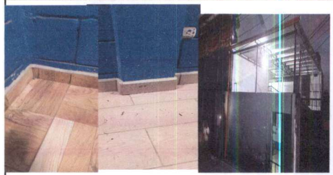
instalación de zocalo lineal en todas la aulas, corredor e instalación de canal pluvial en pvc.