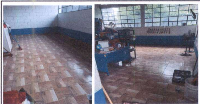
Instalación de piso cerámico, salon 4 y 5 segundo nivel.