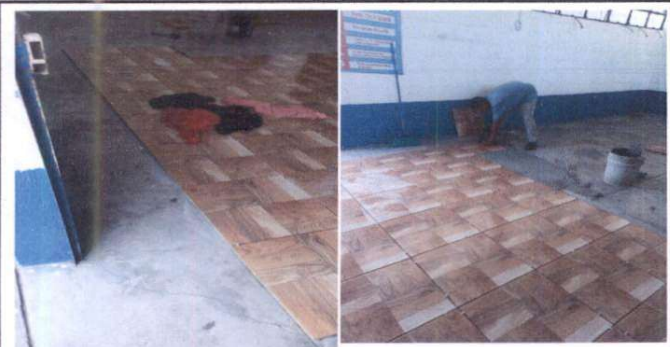
Instalación de piso cerámico, salon 4 y 5 segundo nivel.