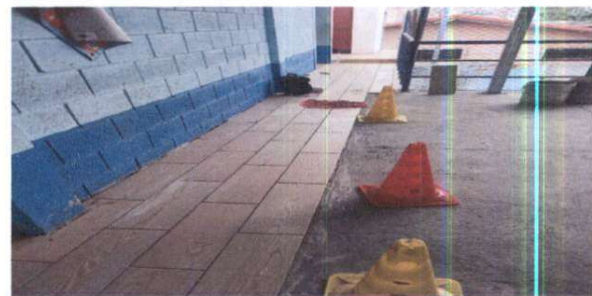
instalación de piso cerámico en corredor, segundo nivel.

Observación: Si es necesario se pueden agregar hojas adicionales y actualizar el registro de hojas.