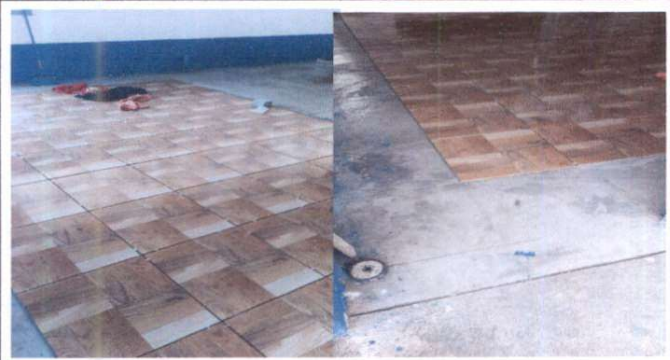
Instalación de piso cerámico, salon 1 y 2 primer nivel.