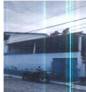
instalación de zócalo de todas las aulas , corredor y instalación de canal pluvial en pvc