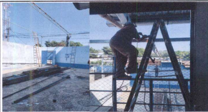
Sustitución de lámina por lámina acanalada zintro alum c/26 legitima.