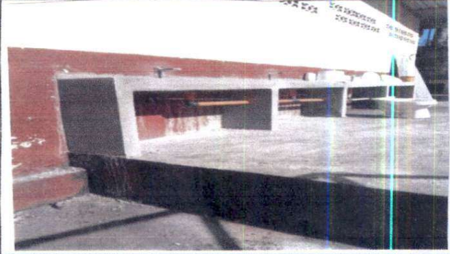
Mantenimiento de lavamanos de concreto. Sustitución de estructura de soporte de metal. Instalación de lámina troquelada. Pintura