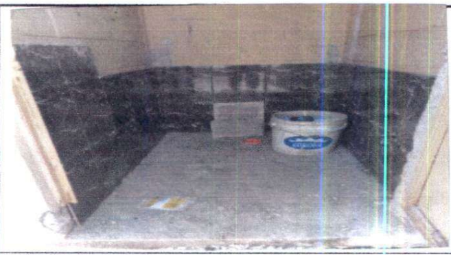
Sustitución de accesorios para sanitarios. Sustitución de azulejo.

Observación: Si es necesario se pueden agregar hojas adicionales y actualizar el número de hojas.