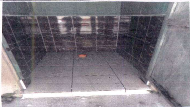
Sustitución de azulejo en sanitarios. Sustitución de inodoro. Instalación de depósito de agua de 2,500 litros con sus accesorios. Suministro de tubería pvc de línea principal aguas negras. Pintura