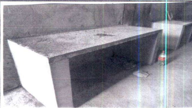
Sustitución de mesas de madera por mesas de trabajo de concreto