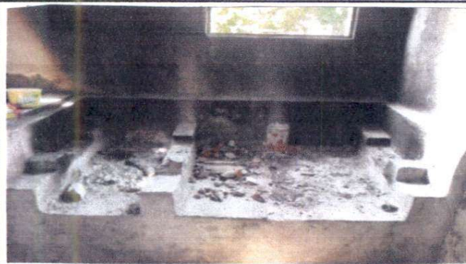
Sustitución de estufa rural completa (incluye chimenea y plancha de metal)