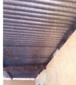
Foto 2: Sustitución de la Laminas de 4.5 metros y estructura metalica.