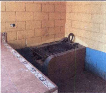
Foto 3: Construcción de un Polletón de 2 metros de ancho por 1 metro de largo x 0.60