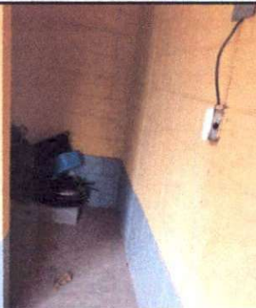
Foto 5: Construcción de Pila de 1 metro de largo por 90 de ancho por 80 de alto.