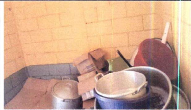
Foto 4: Construcción de Gabinete de cocina de 2.60 metros de ancho por 1 metro de alto y puerta de metal para el gabinete.