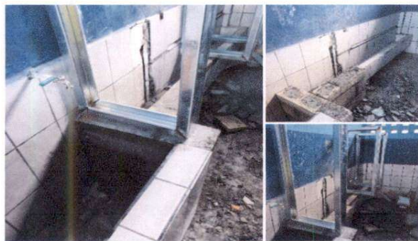
Reparación de mijitorio y divisiones