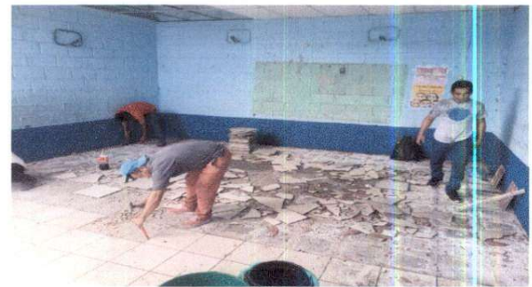
Sustitución de piso ceramico por piso nuevo ceramico

Observación: Si es necesario se pueden agregar hojas adicionales y actualizar el número de hojas.