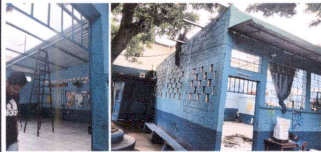
Sustitución de cambió de lámina y estructura de techo aula 3