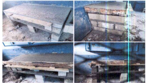
Sustitución de mesa de madera por plancha de concreto azuleado, para la cocina.