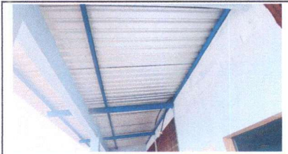
SUSTITUCIÓN DE LAMINA DE AULA