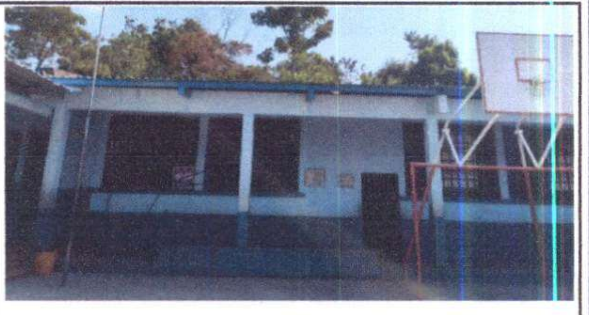
SUSTITUCIÓN DE ESTRUCTURA METÁLICA

Observación: Si es necesario se pueden agregar hojas adicionales y actualizar el número de hojas.