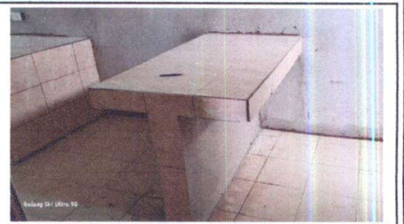
DESAYUNADOR QUE SERVIRÁ PARA SERVIR LOS ALIMENTOS DE LOS NIÑOS