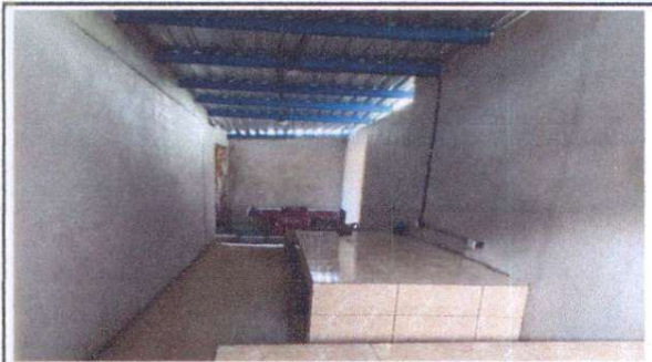
BODEGA REMODELADA PARA COCINA