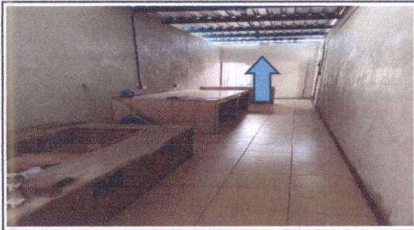
PARED TERMINADA PARA ASEGURAR LA COCINA