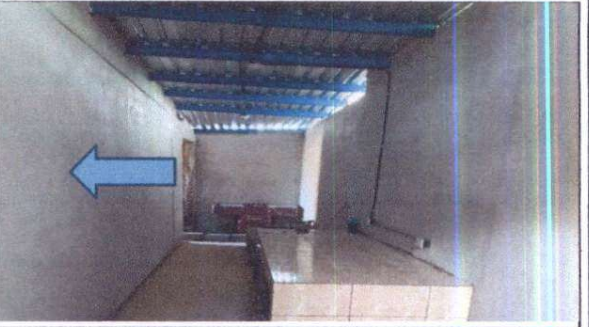
SE CERRÓ LA VENTANA