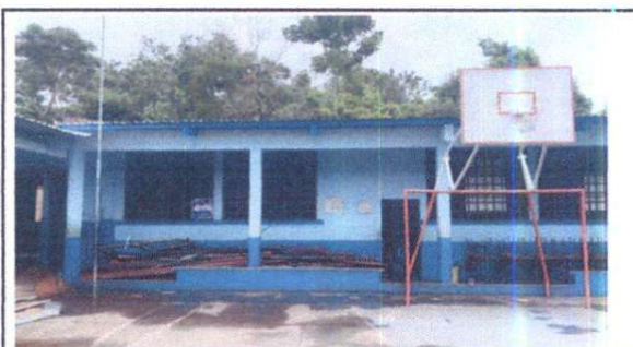
SUSTITUCION DE ESTRUCTURA METALICA

Observación: Si es necesario se pueden agregar hojas adicionales y actualizar el número de hojas.