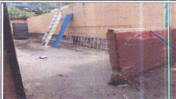
PARED QUE SERÁ SUSTITUIDA POR UN DESAYUNADOR