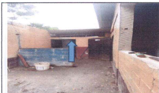
TERMINACIÓN DE PARED PARA ASEGURAR EL AREA DE COCINA