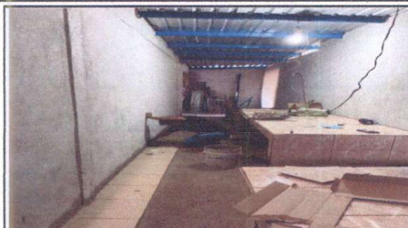
BODEGA QUE SERÁ REMODELADA PARA COCINA