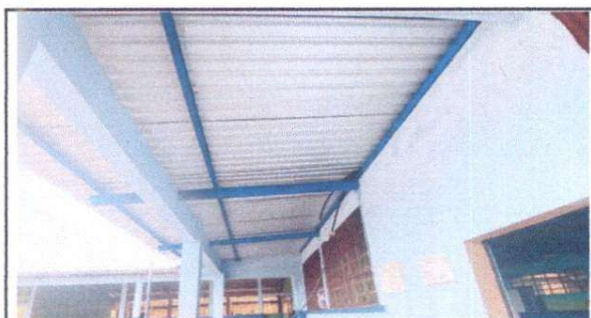
SUSTITUCIÓN DE LAMINA DE AULA