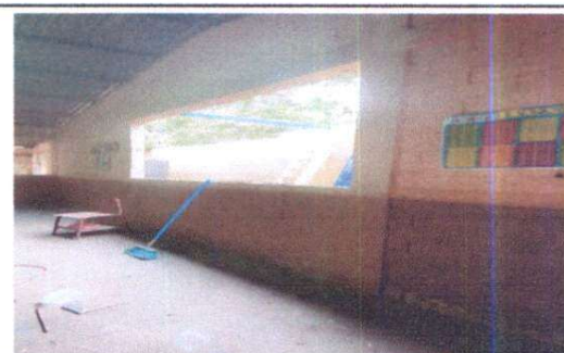
SE CERRARA LA VENTANA