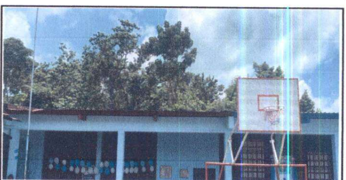
Sujstitución de estructura metálica

Observación: Si es necesario se pueden agregar hojas adicionales y actualizar el número de hojas.