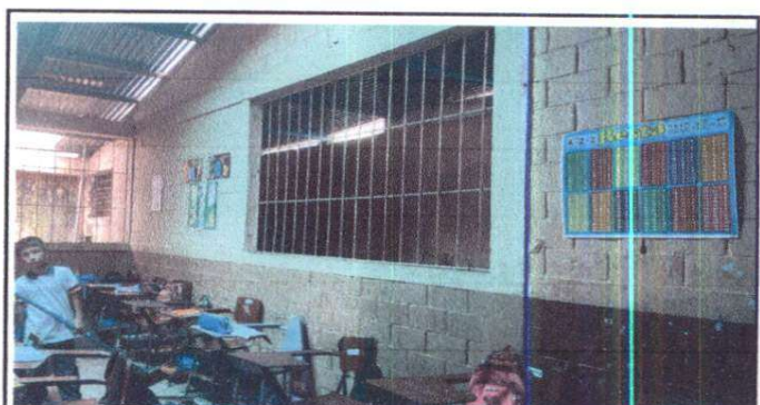
Ventana que será cerrada