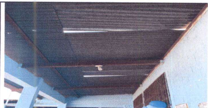
Sustitución de lámina de aula