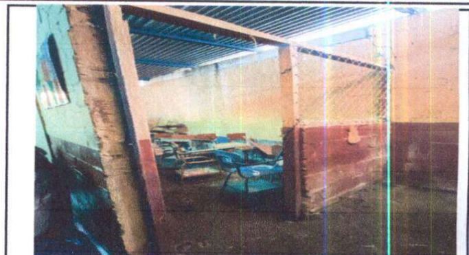
Pared que será sustituida por un desayunador