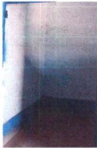
Foto1: Mantenimiento y puesta de chapa .