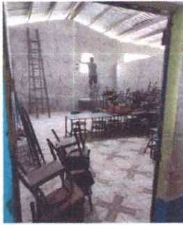
Foto1: Mantenimiento y puesta de chapa .