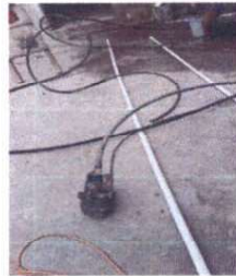
Foto 6: Sustrucción de bomba sumergible, tipo bala, cambio de tubería PVC y cableado de bomba de agua.

Observación: Si es necesario se pueden agregar hojas adicionales y actualizar el número de hojas.