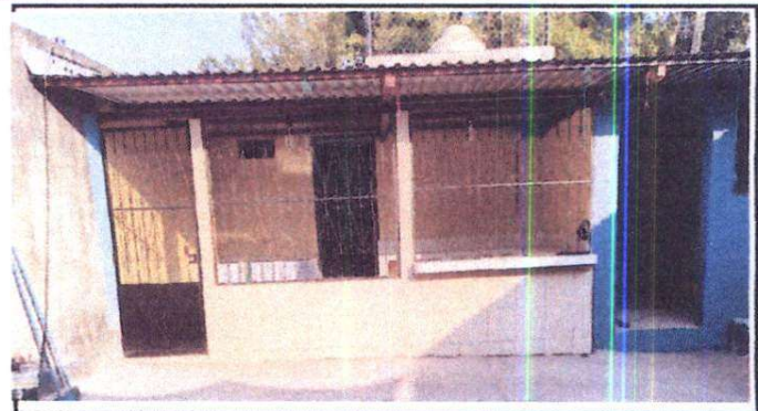
balcones y puerta del area de cocina