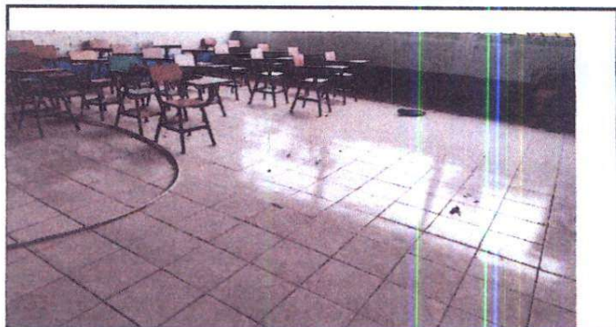
Foto 6: Sustitución de piso de torta de concreto por piso cerámico

Observación: Si es necesario se pueden agregar hojas adicionales y actualizar el número de hojas.