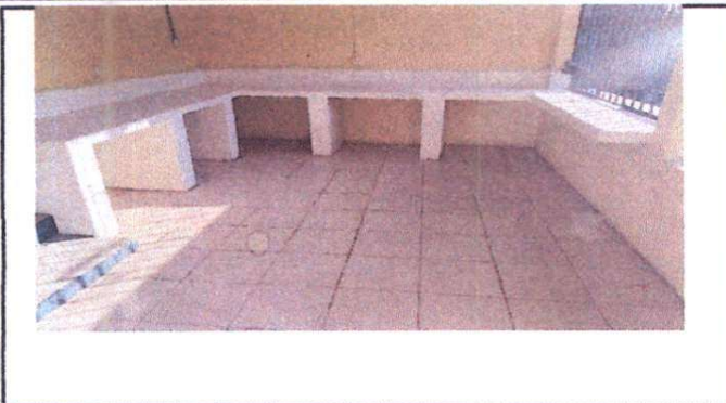
Foto 1: Reparación de area de cocina, sustitución de piso de torta de concreto por piso cerámico, suministro de gabinetes de concreto revestido de azulejo, sustitución de pila de dos lavaderos y sustitución de