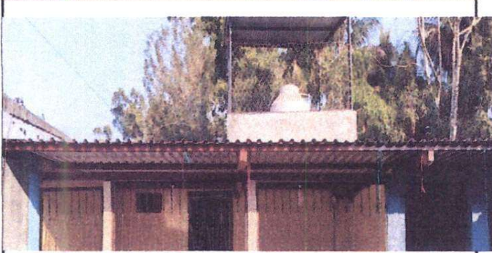
Foto 3: Sustitución de cubierta de lámina y estructura de soporte de metal, aplicación de pintura y sustitución de sistema eléctrico en cocina exterior.