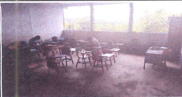
Foto 5: Sustitución de piso de torta de concreto por piso cerámico