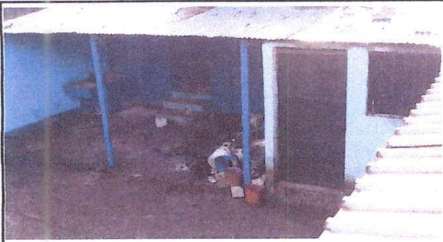
Foto 3: Sustitución de cubierta de lámina y estructura de soporte de metal, aplicación de pintura y sustitución de sistema eléctrico en cocina exterior.