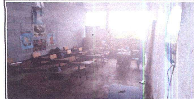
Foto 6: Sustitución de piso de torta de concreto por piso cerámico

Observación: Si es necesario se pueden agregar hojas adicionales y actualizar el número de hojas.