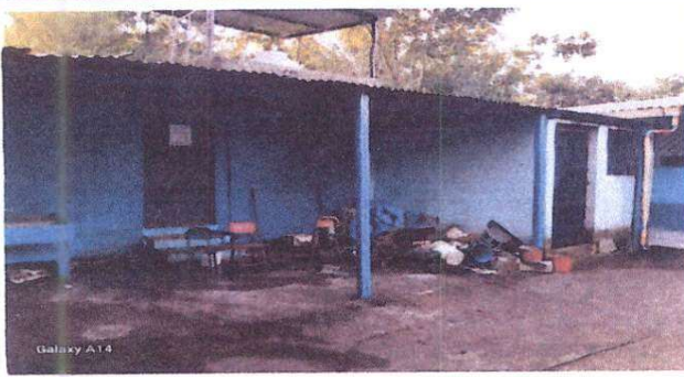
Foto 1: Reparación de área de cocina, sustitución de piso de torta de concreto por piso cerámico, suministro de gabinetes de concreto revestido de azulejo, sustitución de pila de dos lavaderos y sustitución de