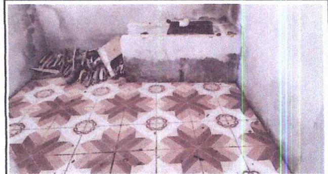
Foto 4: Ampliación de área de estufa rural, incluye plancha y chimenea