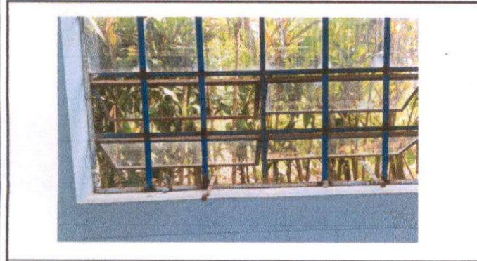
Foto1: Cambio de estructura en ventanal.