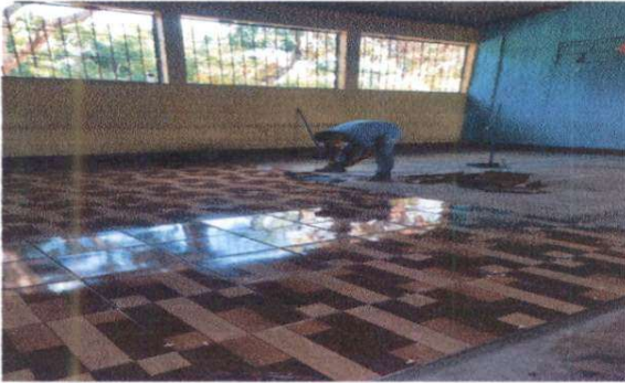
Foto1: sustitución de torta de cemento a piso ceramico aula,