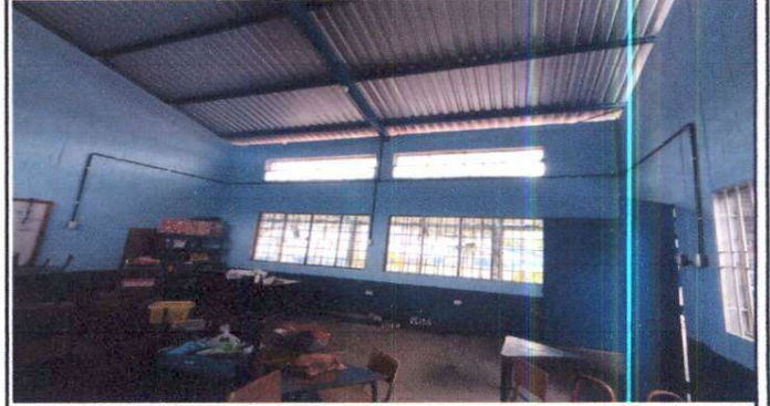
Cambio de lamina POSTERIOR