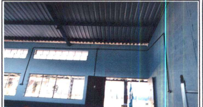
Cambio de sistema eléctrico POSTERIOR