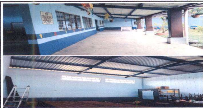
Pintura del Establecimiento POSTERIOR