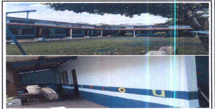
Pintura del Establecimiento POSTERIOR

Observación: Si es necesario se pueden agregar hojas adicionales y actualizar el número de hojas.