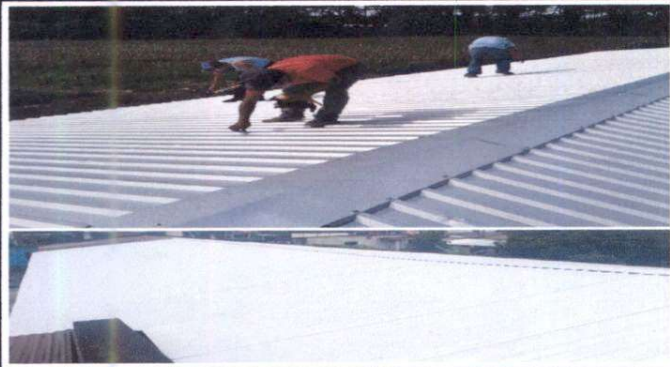
Cambio de lamina POSTERIOR