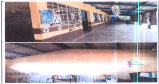
pintura del establecimiento

Observación: Si es necesario se pueden agregar hojas adicionales y se permite el uso de hojas.