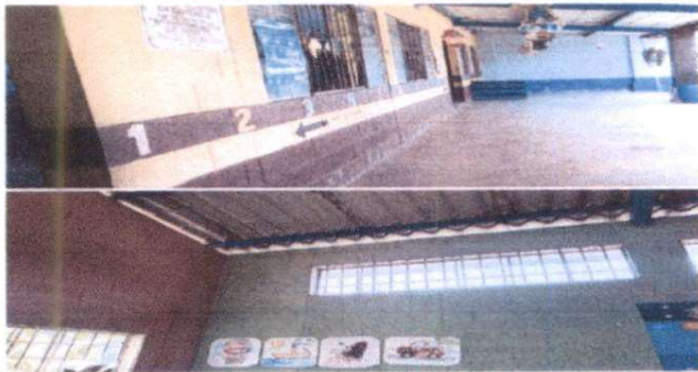
Pintura del establecimiento