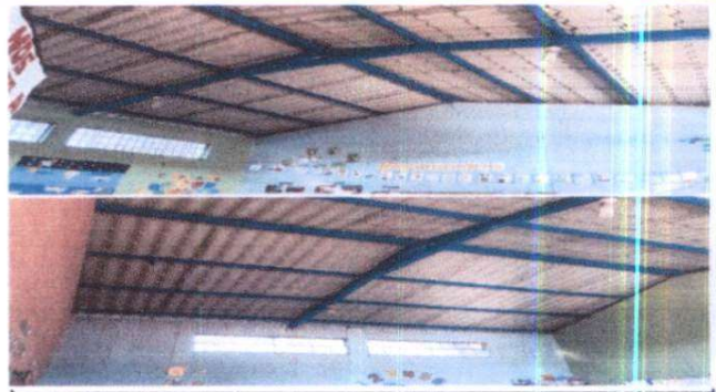
cambio de lamina