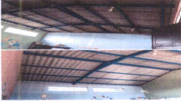
cambio de lamina