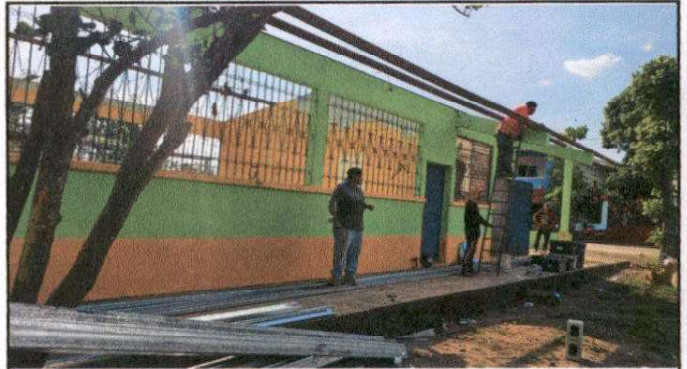
SUSTITUCIÓN DE CUBIERTA DE LÁMINA