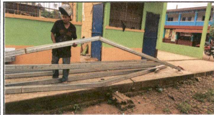
SUSTITUCIÓN DE CUBIERTA DE LÁMINA