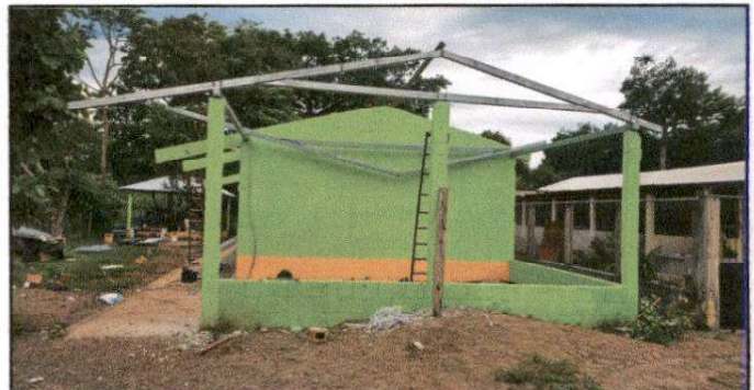
SUSTITUCIÓN DE COSTANERAS

Observación: Si es necesario se pueden agregar hojas adicionales y actualizar el número de hojas.