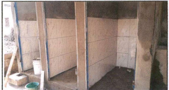
SUSTITUCIÓN DE PISO DE CONCRETO POR PISO ANTIDESLIZANTE