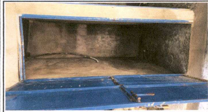
SUSTITUCIÓN DE ACCESORIOS PARA BAÑOS