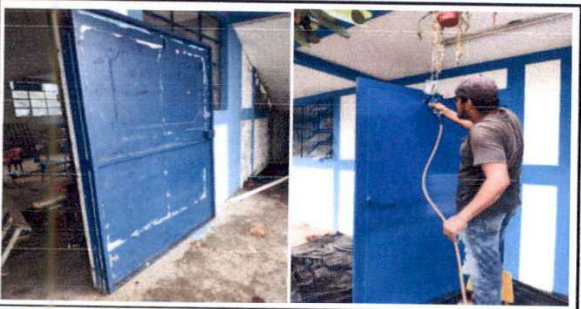
F.5 Mantenimiento de puertas de metal.