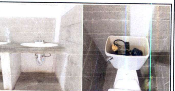
F.6 Sustitución de accesorios en 2 lavamanos y en 1 inodoro.

Observación: Si es necesario se pueden agregar fotos adicionales y actualizar el número de hojas.