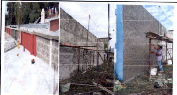
F.3 Impermeabilización de pared exterior en parte posterior de aulas y cara interna de aulas con presencia de humedad y sellado de junta de construcción entre módulo de gradas.