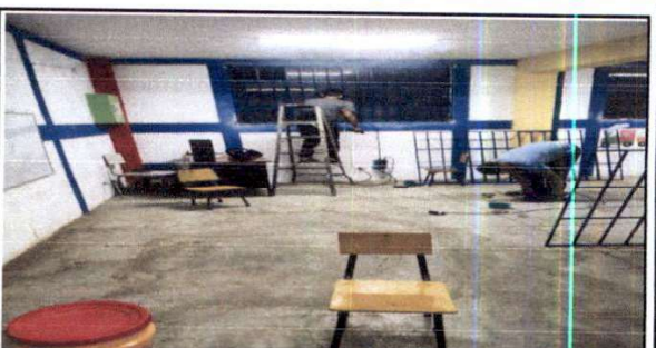
F.4 Suministro de balcón de estructura metálica.