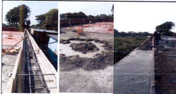
F.1 Suministro de solera de concreto armado de 0.15 x 0.20 metros con marquesina y gota de cenefa, reparación de pared con suministro de cernido monocapa e impermeabilización de pared exterior e interior.