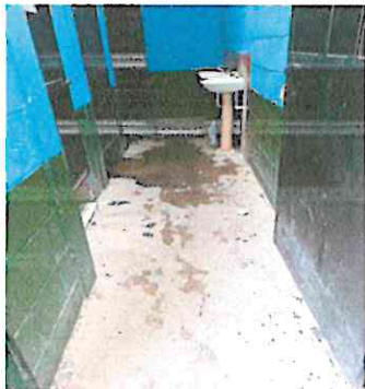
Foto1: Sustitución de piso de concreto por piso antideslizante.