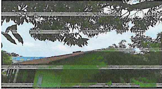
Foto1: Sustrucción de lamina.