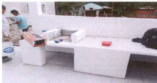
FOTO 5. Ampliación de polleton