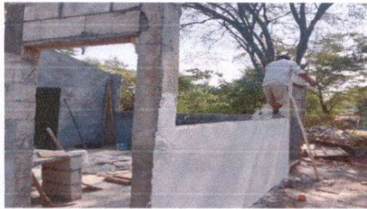
FOTO 1. Sustitución de dos puertas de madera por puertas de metal.