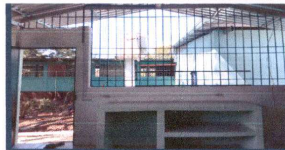
FOTO 6. Sustitución sistema electrico.

Observación: Si es necesario se pueden agregar hojas adicionales y actualizar el número de hojas.