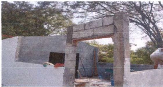
FOTO 3. Cernido y Repello , interior y exterior de cocina.