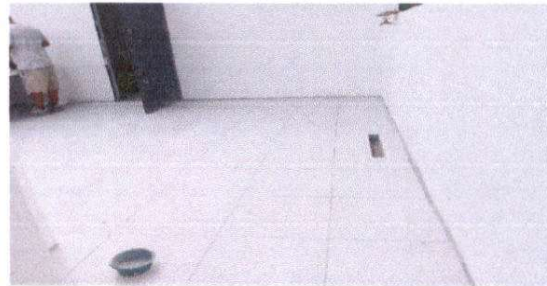
FOTO 4. Sustitución de piso de cemento por ceramico.