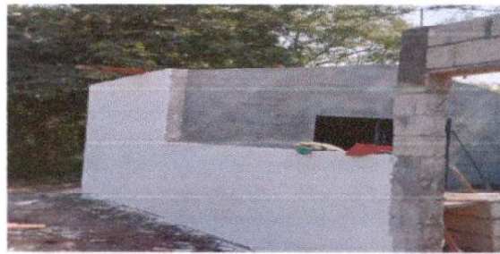
FOTO 2. Sustitución de laminas.