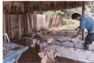
Foto 6: Sustitución de polleton por estufa rural completa con parrilla y chimenea 2.00 mts.x0.70 mts (incluye mano de obra)

Observación: Si es necesario se pueden agregar hojas adicionales, se debe indicar el número de hojas.