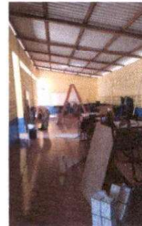
Foto 4: Sustitución de portao interior de madera por porton de metal con rodo 5.00 x2.30 (incluye mano de obra)