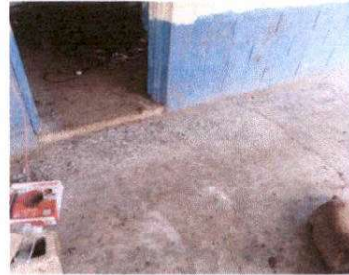
Foto 2 Sustitución de piso de concreto por piso ceramico