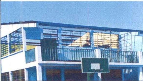
Sustitución de cubierta de lámina