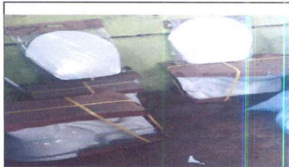
Sustitución de inodoros