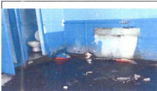
Sustitución de pila de un lavadero y reparación de drenaje sanitario, sustitución de tubería de abastecimiento de agua