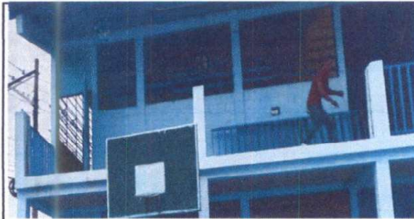
Sustitución de barandales de metal