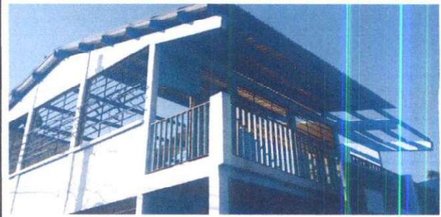
Sustitución de cubierta de lámina y mantenimiento de estructura de soporte en módulo de aulas, susitución de ventana y suministro de balcones