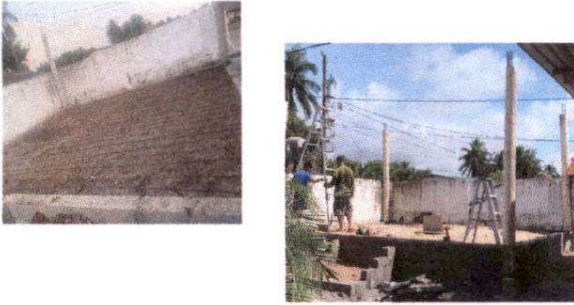
FOTO 1: Suministro de Lamina Troquelada cal 26, estructura de madera y piso. Escenario