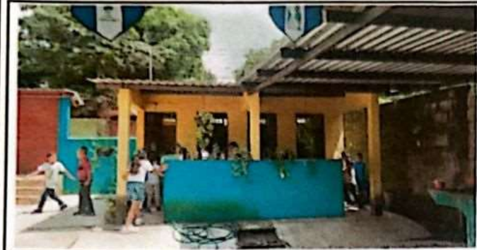
Foto 1: Instalacion de tinaco de 1100 litros más accesorios para abastecimiento de agua potable por gravedad.