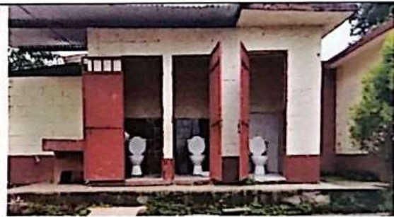
MANTENIMIENTO DE BAÑOS

Observación: Si es necesario se pueden agregar hojas adicionales y actualizar el número de hojas.