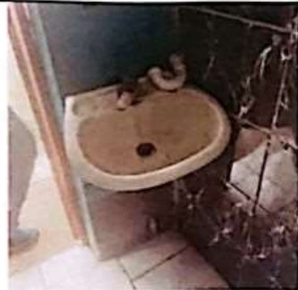
SUSTITUCION DE LAVAMANOS POR LAVAMANOS DE PEDESTAL