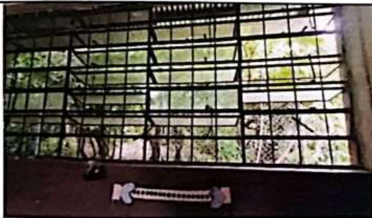
MANTENIMIENTO Y REFORZAMIENTO DE VENTANA