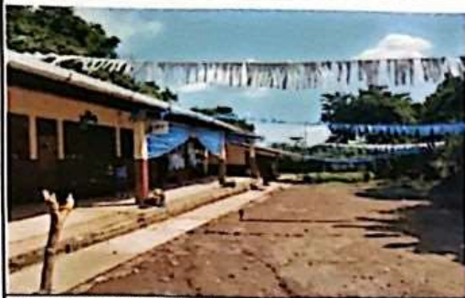
SUMINISTRO DE CUNETA