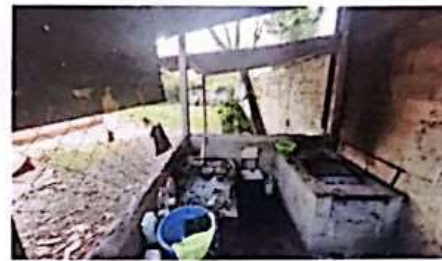
REPARACION DE COCINA