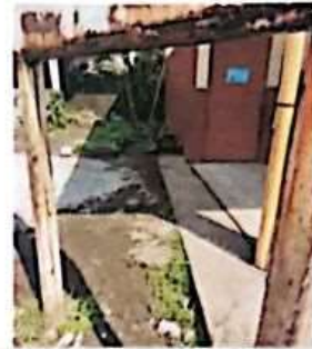
SUMINISTRO DE BANQUETA