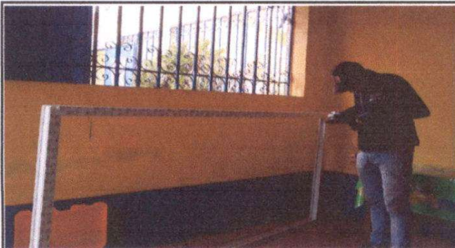
Foto 3: Suministro de puerta de metal de 1.0 X 2.10, Suministro de ventana PVC blanco con vidrio claro.