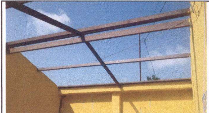
Foto 4: Sustitución de lámina troquelada calibre 26 Sustitución de estructura de metal costanera 3*2 chapa 18 (Lijado y pintado)