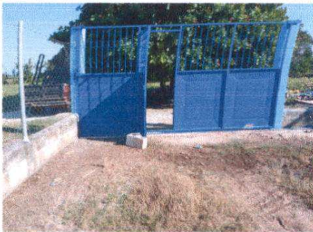
INSTALACION DE PORTON DE METAL