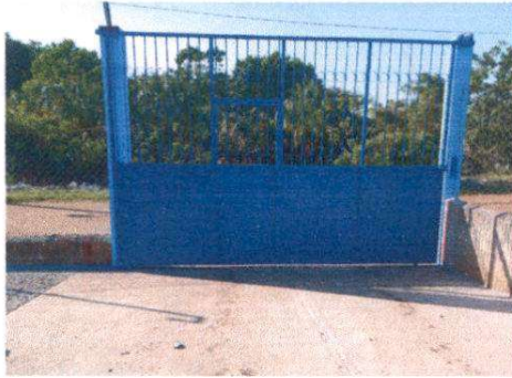
SUSTITUCIÓN DE PORTÓN