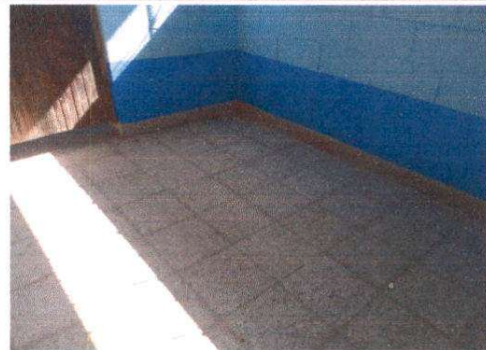
SUSTITUCION DE PISO DE CONCRETO POR PISO CERAMICO