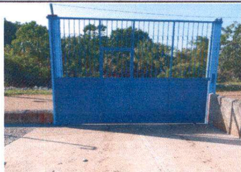
FUNDICION DE LOSA EN INGRESO

Observación: Si es necesario se pueden agregar hojas adicionales y actualizar el número de hojas.