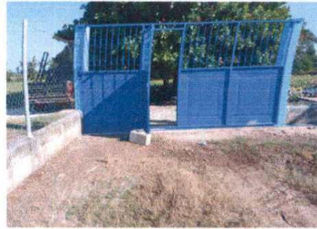
INSTALACION DE PORTON