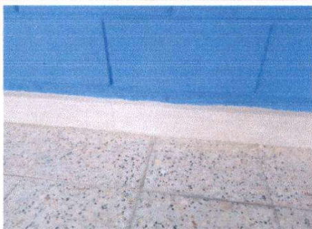
INSTALACION DE ZOCALO CERAMICO