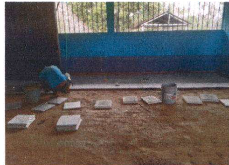
SUSTITUCION DE PISO DE CONCRETO POR PISO CERAMICO