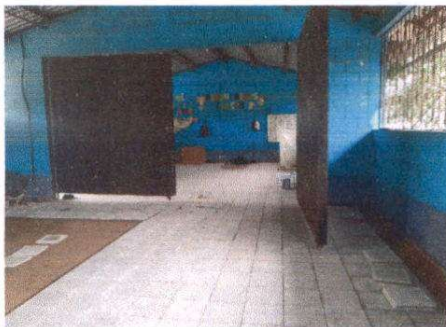
INSTALACION DE ZOCALO CERAMICO