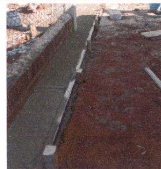
FUNDICION DE LOSA EN INGRESO

Observación: Si es necesario se pueden agregar hojas adicionales y actualizar el número de hojas.