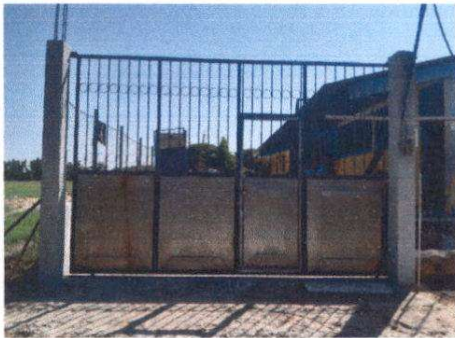
INSTALACION DE PORTON DE METAL