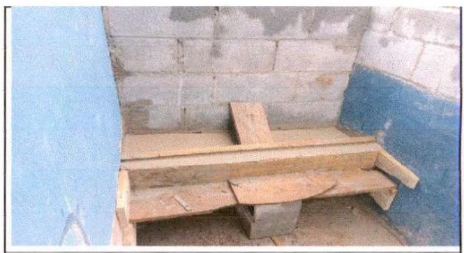
Sustitucion de Repello por azulejo en Minjitorio.

Observación: Si es necesario se pueden agregar hojas adicionales, indicando el número de hojas.