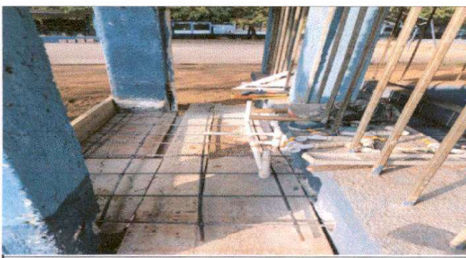
Sustitucion de Lavamanos de concreto por lavamanos de concreto de 1.60 x 0.75 x 0.80 mts. (incluye 3 chorros de metal)