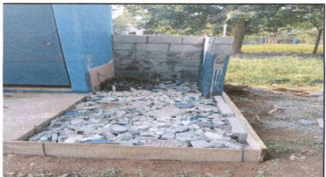
Sustitucion de Minjitorio por modulo de minjitorio. 1.55 x 0.60 x 0.50 mts. (incluye chorro de metal)