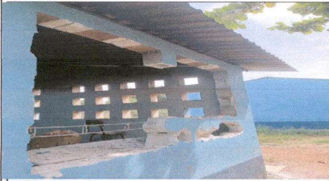
Suministro e instalacion de ventana de Metal, tipo balacin de 2.20 mts. X 1.50 mts.