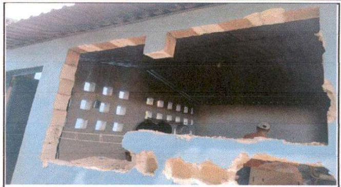
Sustitucion de Polleton, por estufa rural 2.0 mts x 0.70 mts, que incluye parrilla y chimenea.