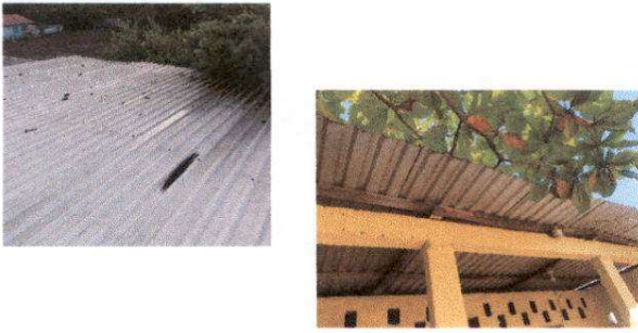
FOTO 1: Suministro de Lamina troquelada cal. 26 mas estructura de madera